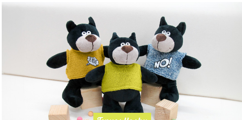
Tenues flashy · 10 ·