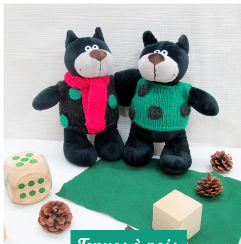
Tenues à pois · 4 ·