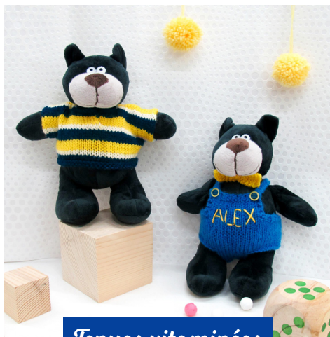
Tenues vitaminées · 6 ·