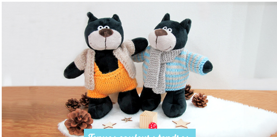
Tenues couleurs tendres · 20 ·