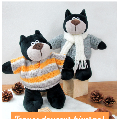
Tenues douceur hivernal · 15 ·