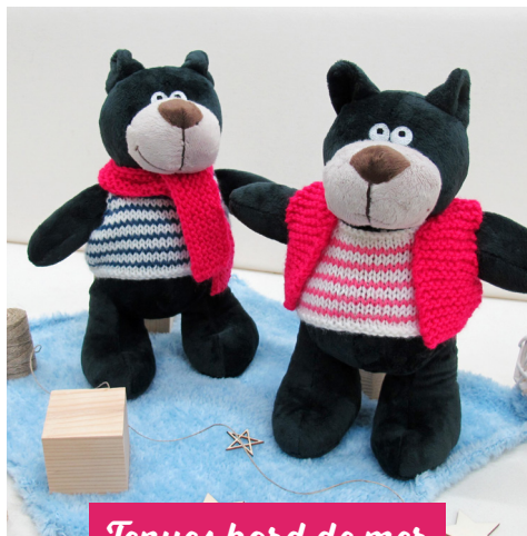
Tenues bord de mer · 12 ·